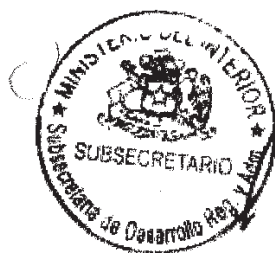
RICARDO CIFUENTES LILLO SUBSECRETARIO DE DESARROLLO REGIONAL Y ADMINISTRATIVO